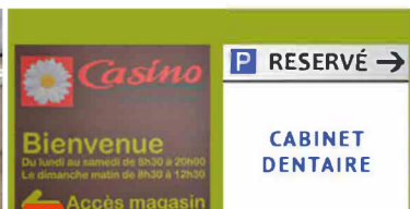
5 À votre droite deux barrières « parking activités » : c'est là !