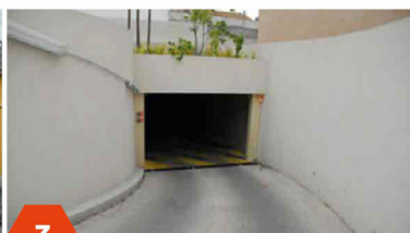
3 Descendre sous la résidence