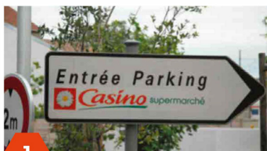
1 Suivre panneaux « parking Intermarché »

Le secretariat vous donnera les codes d'accès aux parkings. Il est indispensable de sortir du bâtiment pour rejoindre dans la rue l'entrée du cabinet, pour cela empruntez la sortie piéton qui vous amène au rez de chaussée.