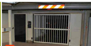
6 Taper le code d'accès fourni par le secrétariat pour rentrer