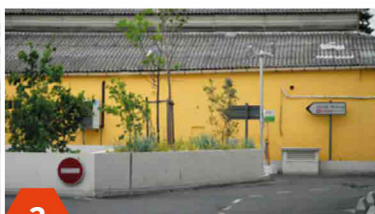
2 Passer derrière la résidence, prendre la descente parking